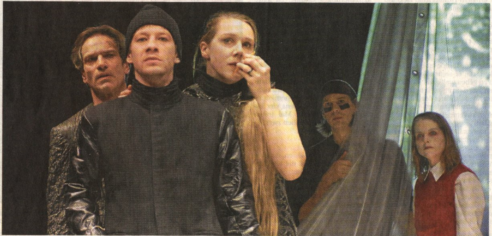
Das Ende naht: König Claudius, Laertes und Königin Gertrude werden von Hamlet und Horatio (v.l.) beobachtet .